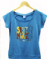
フェルトレードの オーガニックコットンを 使用したTシャツは、肌触りが 良く何枚でも欲しくなる ような熱心な人気。 Tシャツ £30