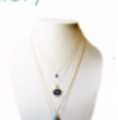
サファイアのネックレス £160、ホースカムオ ネックレス £295、 Labradoriteの ネックレス £275、 トルマリンネックレス £265