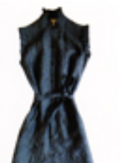
シャンブレー素材の クラシックな黒金糸。 スリップレスで一枚で ボーリーな雰囲気が作り できる。ワンピース $225 / Soeur by Sir.