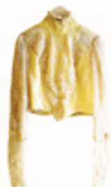
クラシックな佇まいが たまらなくクールな ヴィクトリアンジャケット。 ジャケット £195 / vintage