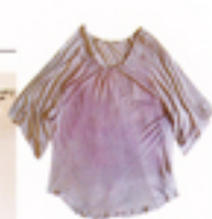
クタクとした素材感で、 ドレープ感ある着こなしを 楽しめそう。ピンクがかった 色合いもグッド。Tシャツ $98 / Soeur by Sir.