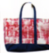
赤とブルーの切り替えが さわやかなアイテム。 大きさは17インチの ノートブックも最適なサイズ。 トートバッグ $115 / Old Village Hall