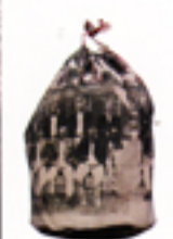
二人用枕よりも巨大さが 際立つかわいらしい。 キャンバス地のユニークな 転写感を堪能してほしい。 巾着袋 $85 / Old Village Hall

Cat さん ノスタルジックな写真をプリントしたバッグや雑貨を扱うユニークなショップ。 いっしょくたのスタイルは嬉しいことばかり。選べる限定の限定品に注目して。