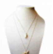
シルバーラビットチャーム ネックレス £125、 ゴールドXシルバーの ホースチャーム ネックレス £130

Dominique さん 2004年にオープン。デザイナーが子供の頃に過ごした経験からビー ズやスパインコールにインスピレーションを受けジュエリーをデザイン。