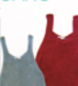
ざっくり感覚がオール シーズン活躍しそうな ニットタンクはハッピーな カラーをセレクト。 タンクトップ各 $65 / WOOL AND THE GANG