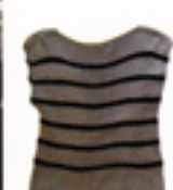
ボーダーパターンも ニットならグッと女性らしい アイテムに。スカートで 女の子気分を満喫。 カットソー $125 / WOOL AND THE GANG