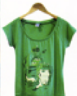
サイト上でイラストを 募集し、読者の人気投票に よってTシャツを製作する というユニークな コンセプトも話題に。 Tシャツ £30