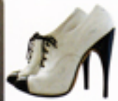
1950年代のハイヒール シューズ。意外とどんな スタイルにも合う実用的 アイテム。シューズ £240 / vintage

Siobhan さん 去年オープンしたばかりのヴィンテージとコンテンポラリーがミックスさ れたライフスタイルショップ。ジャケット、ドレス、ともにvintage